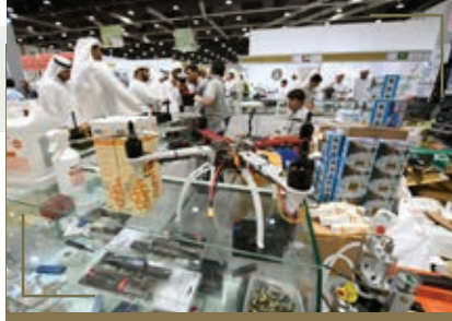
مسابقة أفضل اختراع في مجال الصقارة والصيد