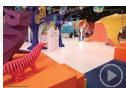
مُسابقة أفضل مقطع فيديو لفعاليات الدورة الـ 18 (أبوظبيي 2021)