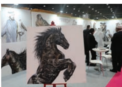
مسابقة أجمل الصور الفوتوغرافية