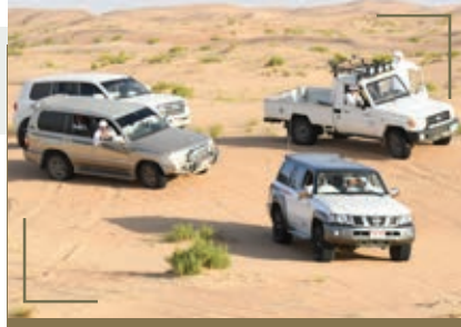
مسابقة أفضل سيارة مُخصّصة لرحلات الصيد

أعلنت اللجنة العليا المنظمة لمعرض أبوظبي الدولي للصيد والفروسية عن إطلاق باقة من المسابقات التراثية والفنية والثقافية، بهدف تعزيز جهود الحفاظ على التراث والتقاليد الأصيلة وصون البيئة والصيد المُستدام، والعمل على استقطاب الأجيال الجديدة للمشاركة في دعم هذه المساعي وتشجيع المواهب الإبداعية لدى الشباب من مختلف الدول.