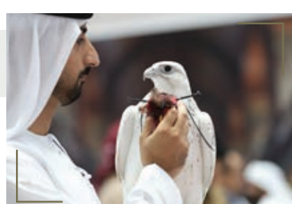
مسابقة أجمل القاصد في الطير والمقناص الشريحة العمرية (20 - 28 سنة)